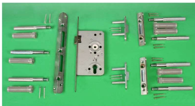
Beispiel eines (Nachrüst-)Fensterbeschlags

Zusätzlich ist ein einbruchhemmender Schutzbeschlag und Profilzylinder erforderlich.