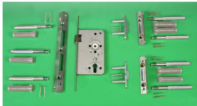
Beispiel eines (Tür-)Nachrüstsets

Auch (Holz-)Türen können mit einem Sicherungssystem im Falz nachgerüstet werden. Zusätzlich ist ein einbruchhemmender Schutzbeschlag und Profilzylinder erforderlich.