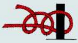
Zwei halbe Schläge

Dient zum Belegen von Festmachern auf Pollern, an einer Reling und anderen festen Gegenständen und ist meistens mit zwei halben Schlägen gesichert