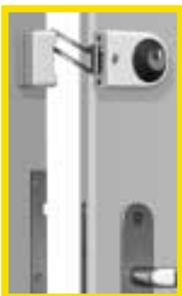
Kastenschloss mit Sperrbügel